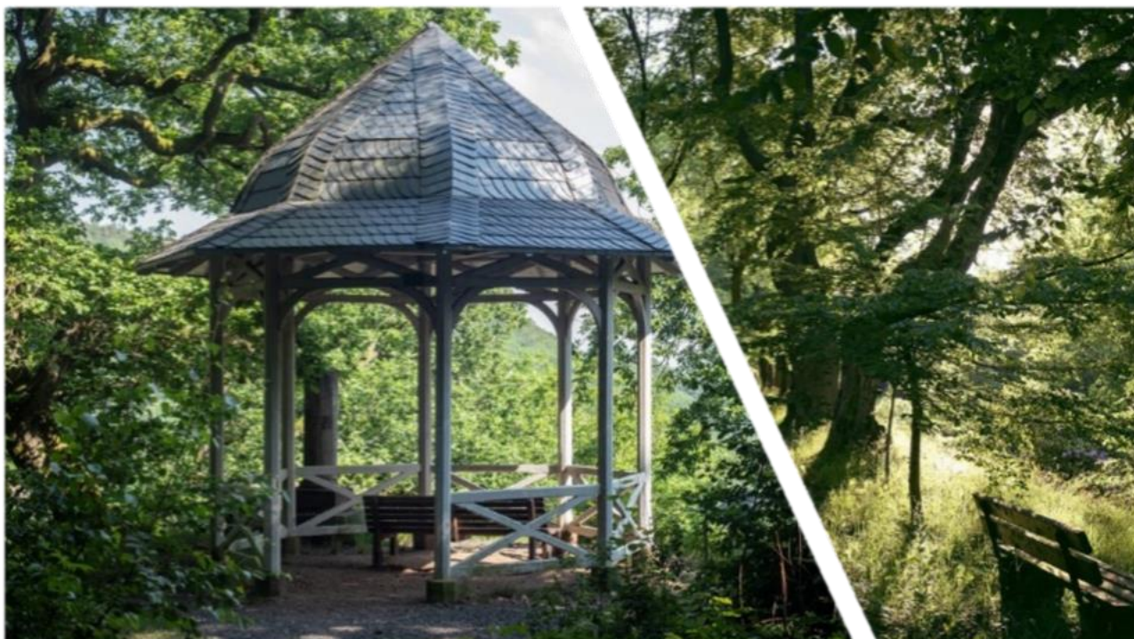
Die Natur als perfekter Rückzugs- und Erholungsort.

zu einem perfekten Rückzugs- und Erholungsort. Es besteht für Patienten auch die Möglichkeit, an kulturellen oder freizeithlichen Aktivitäten der Gemeinde Schlangenbad teilzunehmen und die Kunstausstellungen, Thermalbäder und die Museen in der Umgebung zu besuchen.