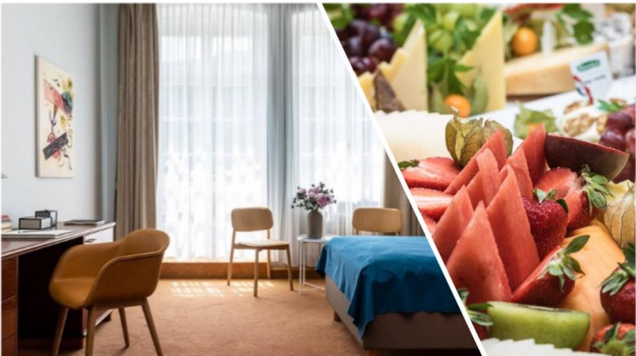
Patientenzimmer mit Wohlfühlatmosphäre sowie eine gesunde und ausgewogene Ernährung.