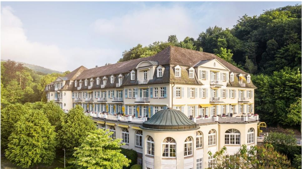
Oberberg Parkklinik Wiesbaden Schlangenbad.

Zentral, aber trotzdem ruhig mitten im Rhein-Main-Gebiet gelegen, bietet die Oberberg Parkklinik Wiesbaden Schlangenbad eine vollstationäre und tagesklinische Behandlung in den Bereichen Psychiatrie, Psychosomatik und Psychotherapie – auf universitärem Niveau und in ansprechendem Ambiente. Gemeinsam mit Patienten werden individuell abgestimmte Therapiepläne entwickelt, die den aktuellen Forschungsstand, die klinische Erfahrung und die persönlichen Präferenzen berücksichtigen. Dabei wird Wert darauf gelegt, stets auf Augenhöhe zu agieren. Die Atmosphäre in der Oberberg Parkklinik Wiesbaden Schlangenbad ist durch Menschlichkeit und Verbundenheit geprägt und zeichnet sich dadurch aus, dass sich Patienten geborgen und wohl fühlen. Die Räumlichkeiten sind deshalb großzügig ausgestattet und bieten mit ihrem freundlichen Ambiente genügend Raum zur persönlichen Entfaltung und zum Rückzug. Das Behandlungskonzept aller Oberbergkliniken basiert auf einem ganzheitlichen Menschenbild. Der Therapieerfolg basiert auf drei Komponenten, die stets individuell zu einer harmonischen Einheit verknüpft werden: Mensch, Wissenschaft und Atmosphäre. Nur wenn alle drei Komponenten perfekt aufeinander abgestimmt sind, sind die besten Voraussetzungen für den Therapieerfolg gegeben.