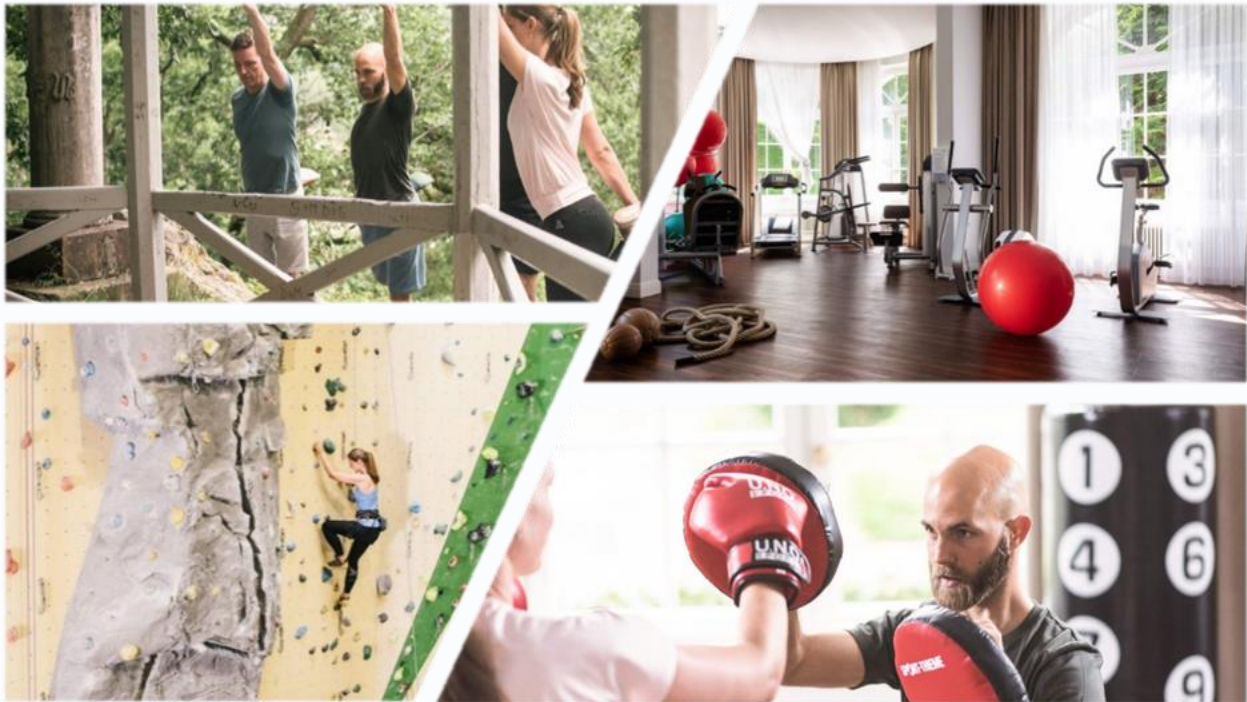
Sport und Bewegung sind ein wichtiges Element bei der Vorbeugung und Behandlung seelischer Störungen.

Die hohe Bedeutung von Sport und Bewegung in der Behandlung psychischer Erkrankungen ist mittlerweile wissenschaftlicher Konsens, allerdings werden diese Erkenntnisse in der Versorgungslandschaft wenig bzw. nur unsystematisch berücksichtigt. In der Oberberg Parkklinik Wiesbaden Schlangenbad nimmt die Sport- und Bewegungstherapie einen besonderen Stellenwert ein, der sich in einem systematischen und breiten bewegungstherapeutischen Angebot ausdrückt. So stehen für Patienten sport- und bewegungstherapeutische Gruppenangebote mit insgesamt 38 Std./Woche (13 Std. niedrige Intensität, 17,5 Std. mittlere Intensität und 7,5 Std. hohe Intensität) sowie Einzelangebote mit 6 Std./Woche zur Verfügung. Die Umsetzung der offiziellen Empfehlungen der WHO für die optimale Nutzung von Gesundheitssport (150 – 300 Minuten/Woche moderate Intensität oder 75 – 150 Minuten/Woche hohe Intensität; Bull et al. 2020, Br J Sport Med) ist somit auch unter Berücksichtigung von motivationalen Aspekten und persönlichen Sportpräferenzen (aerobes und anaerobes Ausdauertraining, Krafttraining, Gymnastik, Ball- und Spielsport, Therapeutisches Boxen, Therapeutisches Klettern, Therapeutisches Bogenschießen, Therapeutisches Tanzen, Yoga, Qigong) in der Oberberg Parkklinik Wiesbaden Schlangenbad stets gewährleistet.