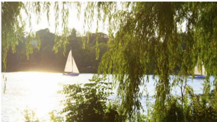
Die Oberberg Tagesklinik Hamburg im Herzen der Stadt.