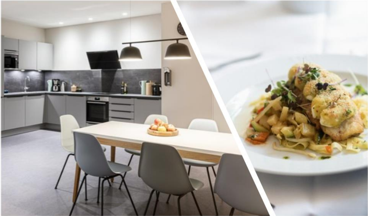
Ausgewogene Ernährung in angenehmer Atmosphäre.