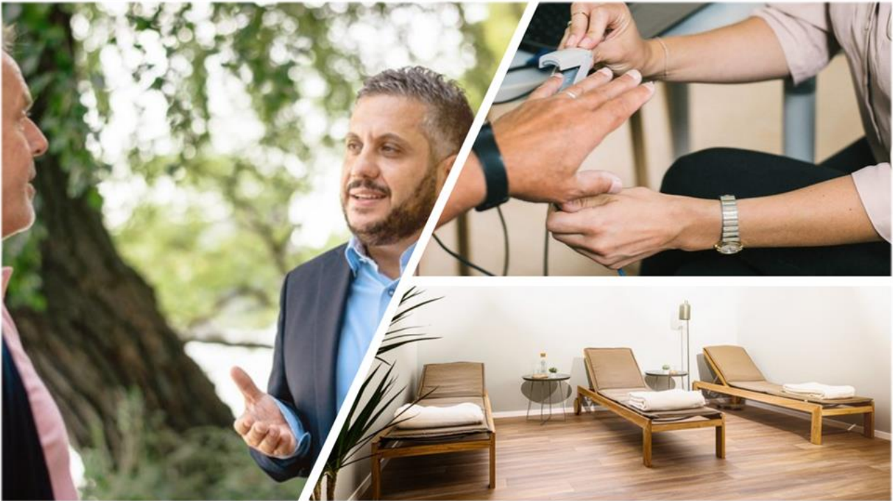
Therapie-Dreiklang für eine ganzheitliche Behandlung: Mensch, Wissenschaft und Atmosphäre.

Die Oberberg Tagesklinik Hamburg liegt in unmittelbarer Nähe zur Binnenalster und Mönckebergstraße. Mit ihrer zentralen Lage bietet die Oberberg Tagesklinik Hamburg ein ausgewogenes Verhältnis zwischen belebter Urbanität und hanseatischer Gelassenheit. In den modernen und großzügigen Räumlichkeiten bietet die Oberberg Tagesklinik Hamburg ein intensives Therapieprogramm, das speziell auf die Bedürfnisse der Patienten angepasst wird. Das allgemeine Behandlungskonzept der Oberberg Kliniken basiert auf einem ganzheitlichen Menschenbild. Bei der Diagnostik werden neben den körperlichen und seelischen Symptomen auch die gesamte Person mit ihrer Biografie, ihrer Persönlichkeit und ihrem sozialen Umfeld betrachtet. Dabei wird stets auf dem neuesten Stand der Wissenschaft gearbeitet und in einer Atmosphäre, in der sich die Patienten wohl und geborgen fühlen. Um bestmögliche Therapieergebnisse zu erreichen und den höchsten Qualitätsansprüchen gerecht zu werden, erfolgt die Behandlung der Patienten nach einem verbindlichen Prinzip: innovativ, intensiv und individuell.